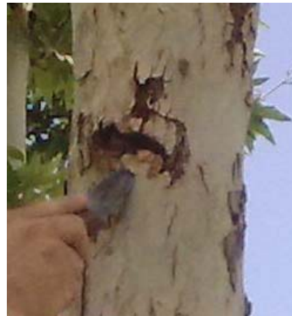
شکل ۱- خسارت S. caucasica روی درخت چنار Figure 1- The damage caused by S. caucasica on plane trees