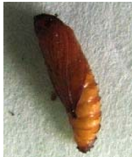
شکل ۳- شفیره S. caucasica Figure 3- The pupa of S. caucasica